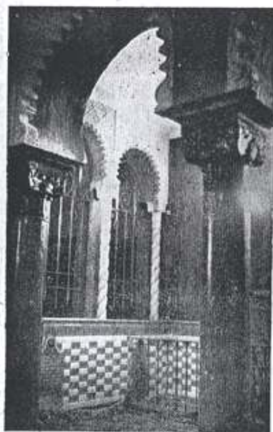
Tombeau du Cheikh EL-ALAOUH